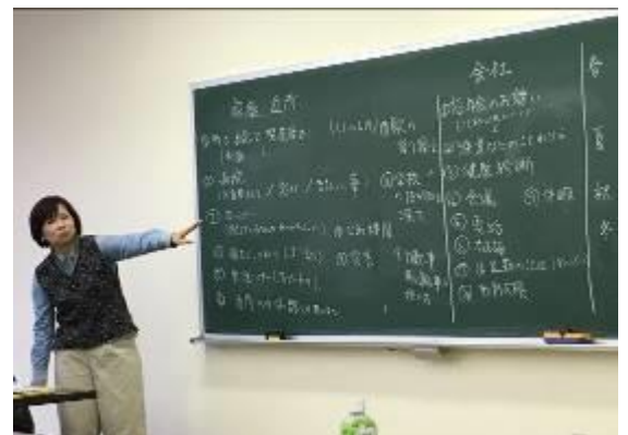
12月21日 日本語指導法研修会