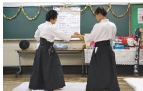
12月18日 年末お楽しみ会 合気道