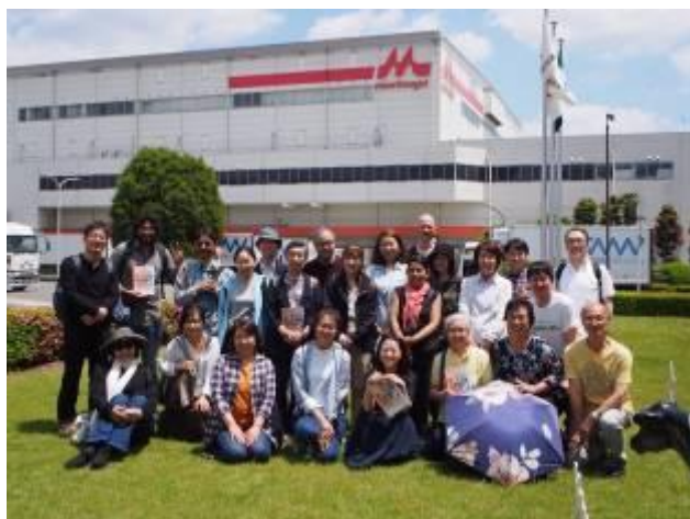
2019 年 5 月 17 日 森永乳業多摩工場見学