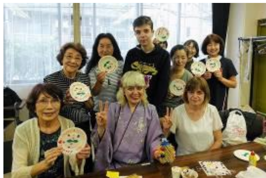
7月4日 ウェルカムサロン「モルドバを知ろう」