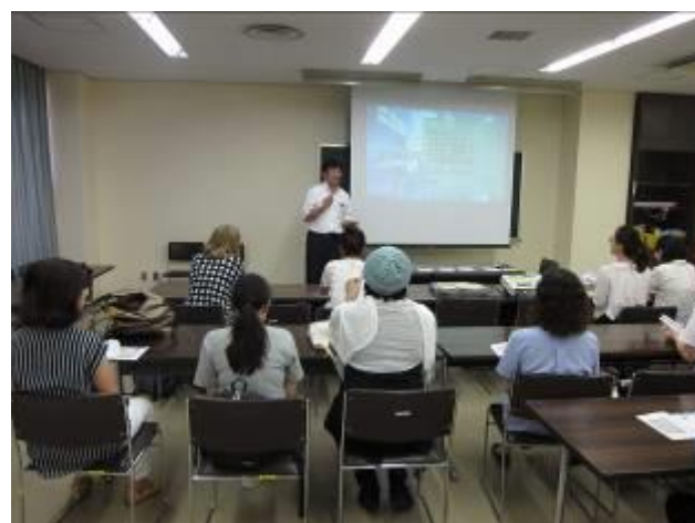
2019 年 7 月 19 日