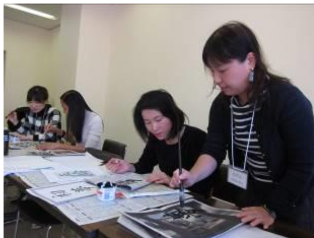
2020 年 1 月 10 日 書初め