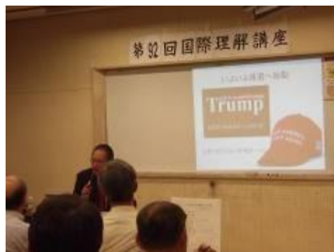
6月15日 国際理解講座