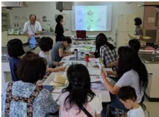
9月17日 外国人おかあさん交流会「ママのための防災講座」