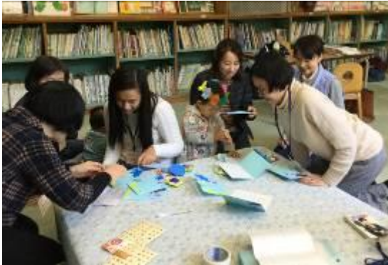
親子日本語サロン