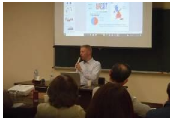
11 月 2 日 英語で語る易しい文化論