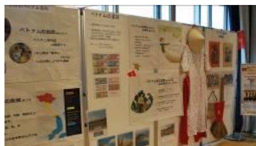
9月21日 NHKコミュニティスクールにベトナム展示を出展