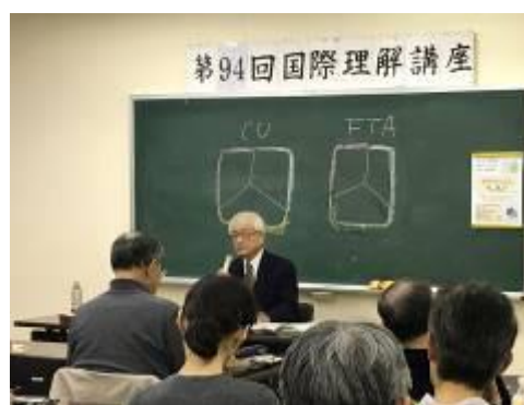
12月14日 国際理解講座