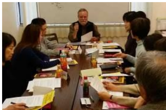
ニュースで学ぶリアルな英会話

ボランティアの協力を得て日本語⇄中国語版と日本語⇄スペイン語版を作成しました。それらの用語集は外国人無料相談会(10 月開催)の通訳ボランティアへ参考資料として配布しました。