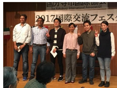
国際交流フェスタの日本語スピーチに参加した学習者の皆さん

■ 詳しい内容は、KIAホームページをご覧ください。 お友だちやお知り合いの方にもご案内ください。