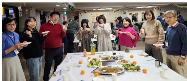
(下)年末お楽しみ会