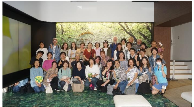
2023年5月19日にサントリー武蔵野工場へ