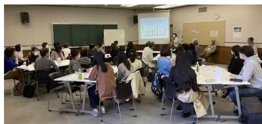
日本語支援ボランティア養成講座の様子