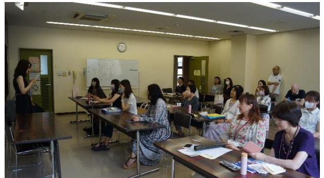
2023年7月14日にスピーチ大会