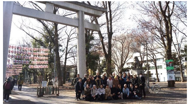
2024年1月19日に大國魂神社へ