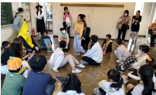
こいがくぼ国際教室 ハロウィンお楽しみ会

外国にルーツのある子どもたちの学習支援教室をKIAでは運営面からサポートをしています。月3回、土曜日14：00～16：00開催。学習者数も当初考えていた定員を超え、戸惑う時期もありましたが、スタッフも増え、なんとか希望する学習者を断らずに今に至っています。3月末時点の登録者数は、子ども21名、ボランティアスタッフ22名です。